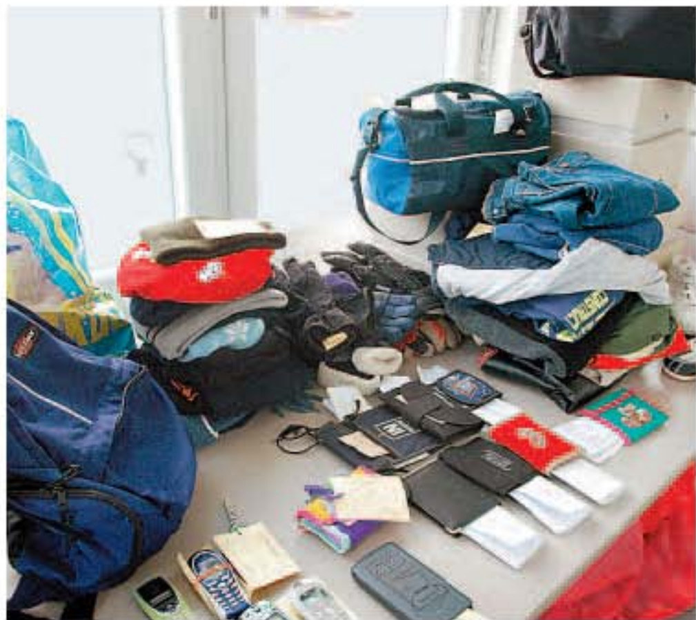
Buntes Sammelsurium: Was in PVM-Bussen liegenbleibt, wartet in der Niederlassung Deuben auf seinen Besitzer.

In Deuben warten Fundsachen aus dem Linienverkehr